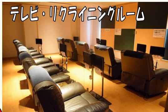
テレビ・リクライニングルーム